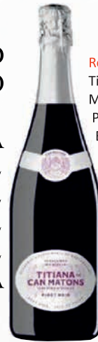
Ref: 02456 Titiana Can Matons Pinot Noir Brut Rosé Ref: 02455 Titiana Pansa Blanca