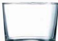
Ref: 900036 Vaso chiquito Mini 23cl (12)