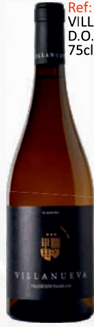
Ref: 3468 VILLANUEVA D.O. Rías Baixas 75cl / (6)