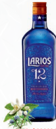
Ref:890031 LARIOS 12 PREM. 70cl