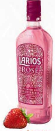
Ref:009086 LARIOS 70cl ROSÉ