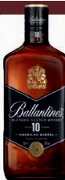
Ref: 009060 10 AÑOS