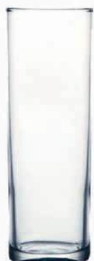
Ref: 900369 Vaso tubo ARC 31cl (24)