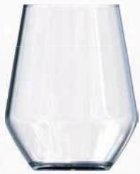
Ref: 900050 Vaso Thera 40cl (6)