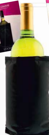
Ref: 900058 Manga Enfriadora KOALA Negra