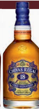
Ref: 009034 18 AÑOS