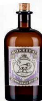
Ref: 009009 MONKEY 47 Gin 70cl