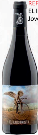
REF: 1553 EL ILUSIONISTA Joven