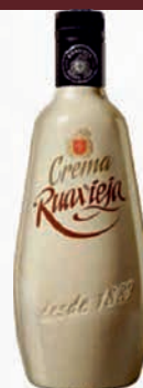
Ref: 009051 Crema Orujo