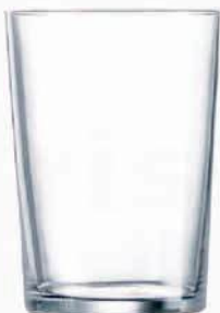
Ref: 902081 Vaso sidra ARC 50cl (6)