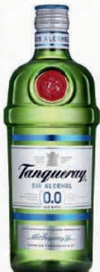
Ref: 760013 Tanqueray 0,0 S/ALCOHOL 70cl