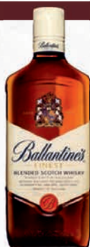
Ref: 009066 ORIGINAL