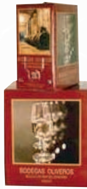
Ref: 3475 Blanco C.N. Ref: 3521 Blanco A.C. Ref: 3478 Tinto T.M. Ref: 3481 T.B.