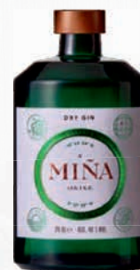
Ref: 009095 A MIÑA ORIXE Gin 70cl