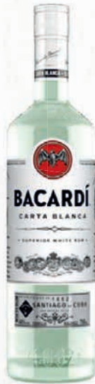
Ref: 003002 BACARDÍ Ron 1L