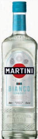
Ref: 003115 MARTINI Blanco 1l

Por 3 botellas; REGALO 6 VASOS DE SIDRA HASTA FIN DE EXISTENCIAS