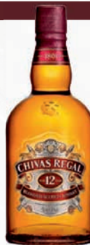
Ref: 009018 12 AÑOS