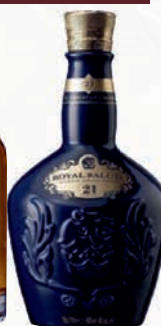
Ref: 009027 Royal 21 AÑOS