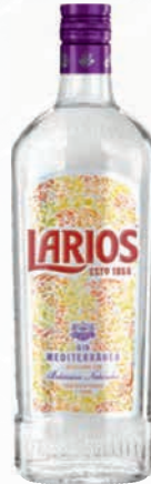
Ref:009001 Gin LARIOS 1 Litro