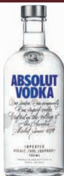
Ref: 890022 Vodka ABSOLUT AZUL 70cl