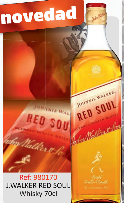
Ref: 980170 J.WALKER RED SOUL Whisky 70cl