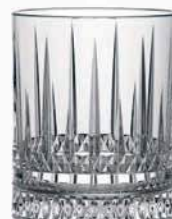
Ref: 900015 Vaso Bajo STYLE 37cl (6)