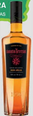
Ref: 870045 Ron Sta Teresa G.Reserva 70cl