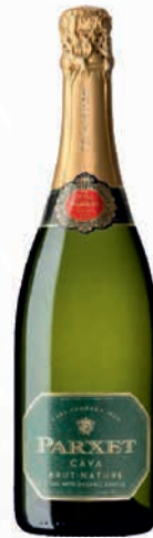
Ref: 02452 Parxet Brut Nature Ref: 02451 Parxet Brut Reserva Eco