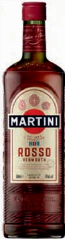
Ref: 003112 MARTINI Rojo 1l