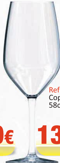
Ref: 900056 Copa Thera 58cl (6)