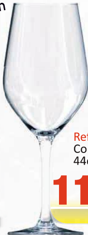
Ref: 900057 Copa Thera 44cl (6)