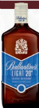
Ref: 009050 LIGHT 20° 70cl