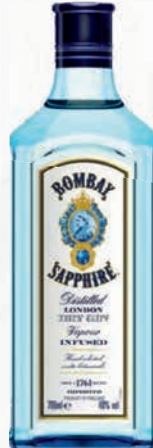
Ref: 003029 Gin BOMBAY Sapphire 70cl