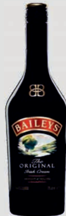
Ref: 980028 Crema Whisky BAILEYS 70cl