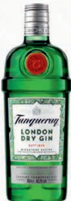
Ref: 760096 Tanqueray Gin 70cl