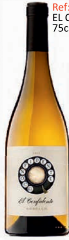
Ref: 1558 EL CONFIDENTE 75cl / (6)