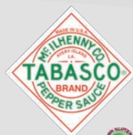
Ref: 009112 ABSOLUT TABASCO 70cl (6)