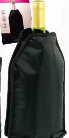
Ref: 900060 Enfriabotellas de Gel Alto