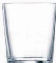
Ref: 902055 Vaso pinta ARC 36cl (6)