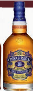
Ref: 009034 18 AÑOS