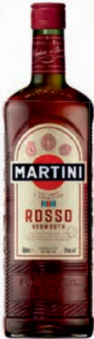
Ref: 003112 MARTINI Rojo 1l