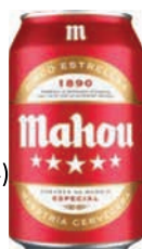
Mahou 5 Estrellas 33cl (24)