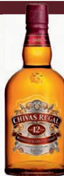
Ref: 009018 12 AÑOS