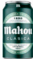
Mahou Clásica 33cl (24)