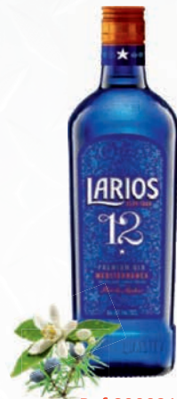
Ref:890031 LARIOS 12 PREM. 70cl