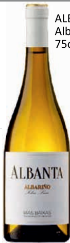
ALBANTA Albariño 75cl (6)