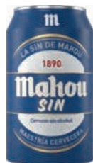
Mahou Sin 33cl (24)