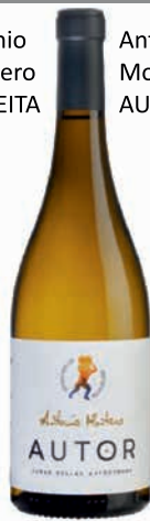
Antonio Montero AUTOR