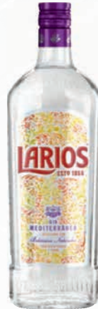
Ref:009001 Gin LARIOS 1 Litro