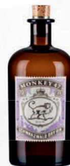
Ref: 009009 MONKEY 47 Gin 70cl