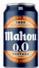
Mahou 00 TOSTADA Lata 33cl (24)