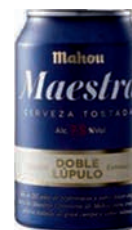
Mahou Maestra 33cl (24)